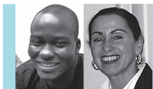
Links: Plakate Biennale Passages seit 2006

Tchekpo Dan Agbetou Künstlerische Leitung und Direktion Artistic Director and Direction Ulla Agbetou Assistenz Künstlerische Leitung und Direktion Assistance of the Artistic Director and Direction